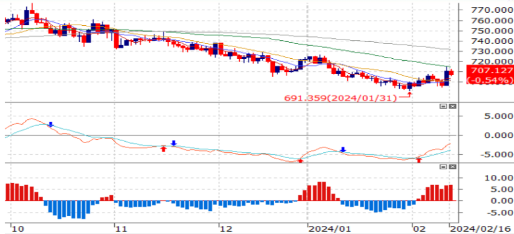
Gambar 2 Grafik Sektor Barang Konsumen Non-Primer